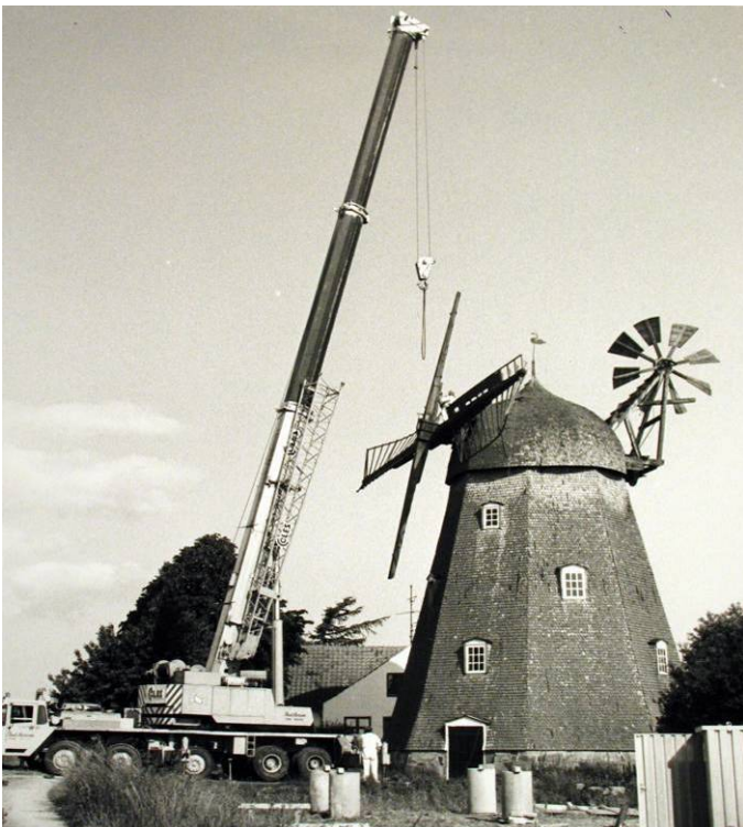
1994. Hatten er løftet på plads og vingerne er ved at blive monteret af firmaet Poul Larsen store gule kran.