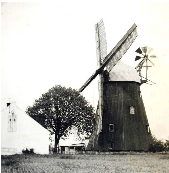
Foto 1936. Da møllen stadig var i funktion.

Møllesiderne er blevet papklædt, med der er endnu nogle mindre arealer med spån.