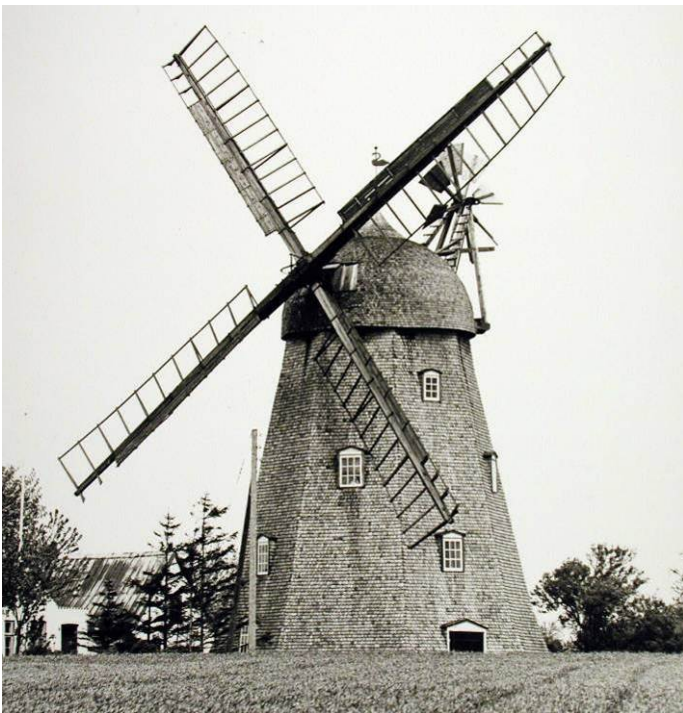
Foto 1972, nogle år efter der var kommet nye spåner på hele møllen.

1966-67 havde byforeningen samlet så mange midler sammen, at møllens papbeklædning, som efterhånden var meget utæt, kunne fjernes og møllen fik nye spåner på hat og møllekroppen, og vindrosen blev fornyet.